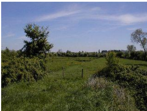
Foto's van geschikte Steenuil biotopen