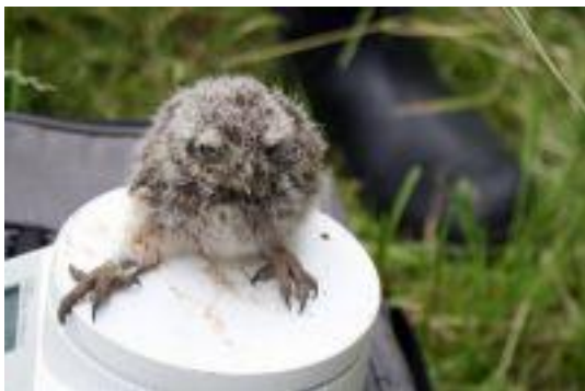
Steenuilkuiken wordt gewogen

In knotwilgen broeden ze op houtpulp en resten van hun eigen braakballen, hierin graven ze zelf een nestkuiltje.