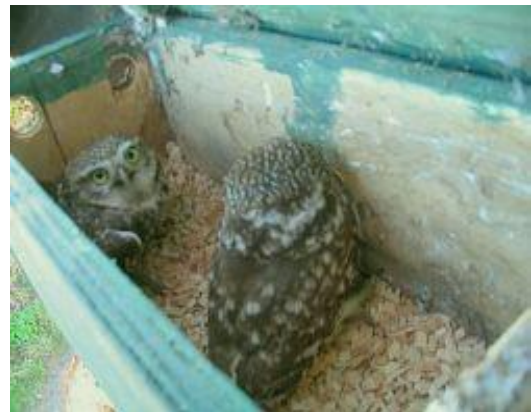
Twee Steenuilen in een broedkast.....

Het voedsel van Steenuilen bestaat voornamelijk uit insecten, muizen en kleine zangvogeltjes. Tijdens het grootbrengen van de jongen wordt afhankelijk van het weer soms veel op regenwormen gejaagd. Maar aan regenwormen blijft modder kleven, waardoor er in de kast soms een zeer vochtige situatie kan ontstaan, ontluichtingsroosters voorkomen dat de luchtvochtigheid te hoog wordt. Steenuilen maken zelf geen nest, daarom worden Steenuilkasten voorzien van een laagje houtkrullen of grof zaagsel.